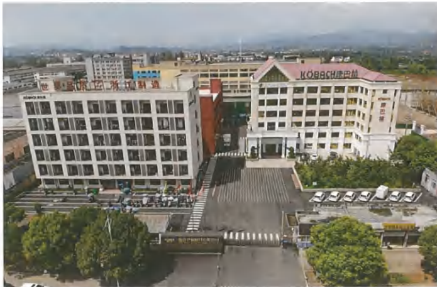
(图为浙江巴赫厨具有限公司实景图)

浙江巴赫厨具有限公司创建于 2012 年 7 月，总部设于金华武义，是一家专业生产与销售各类锅具的民营实体与电商应用结合的企业，致力于打造“全球锅具之王”。公司目前拥有员工 1500 余人，其中管理及研发人员 300 多人，公司有硕士 12 人，大学以上学历 400 余人。公司拥有金华、德国两大研发、生产、销售基地，拥有现代化工厂 45000 平米，目前在建智能化工厂面积约 90000 平米。