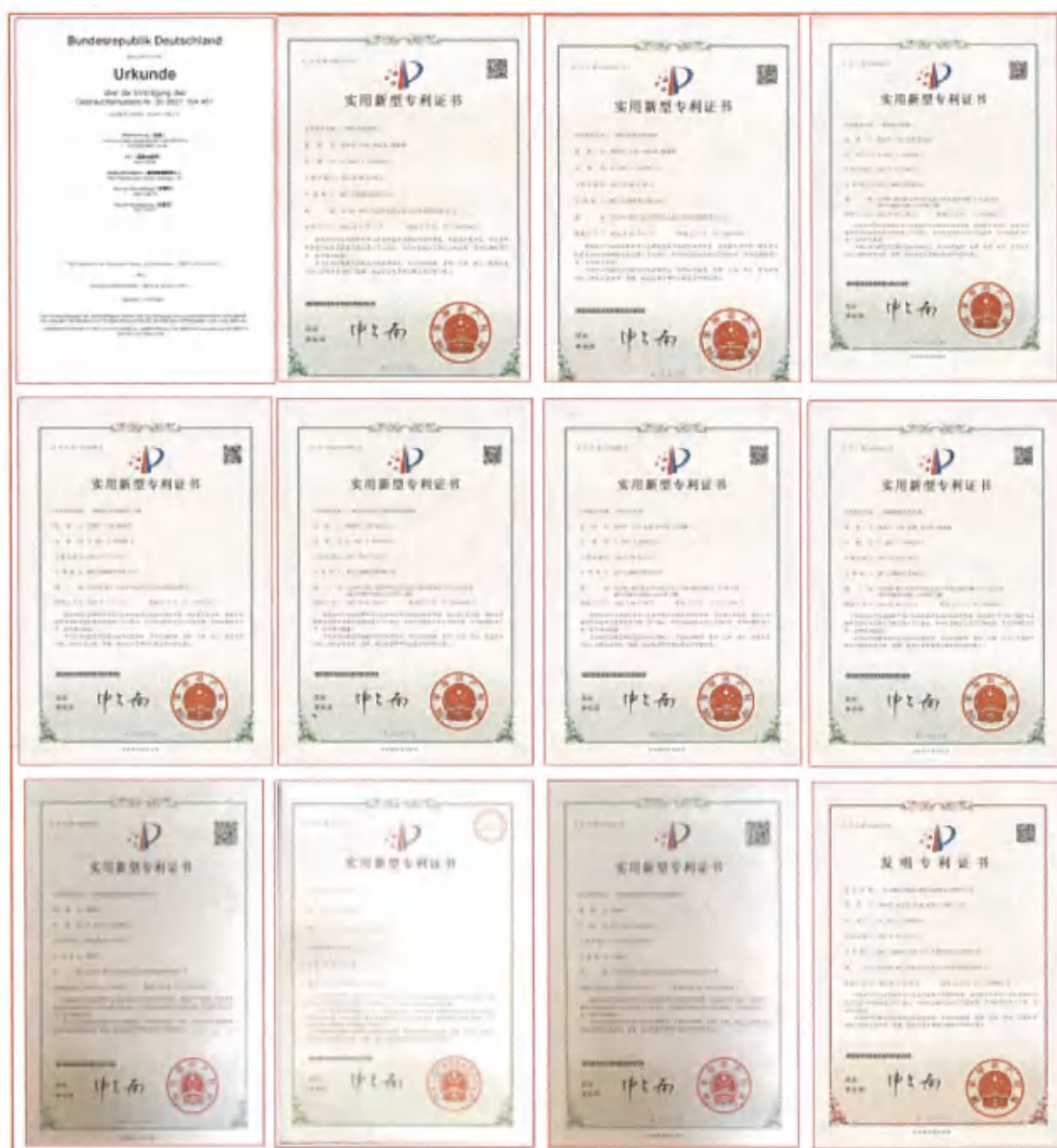
(图为部分专利证书展示)

的同时，巴赫厨具在线上营销层面一枝独秀：2019-2021 年阿里巴巴天猫平台上连续 3 年占据高端锅具销量第一；并成功与拼多多、唯品会、云集等知名社交电商平台强强合作，同时与一线明星签定品牌推广合同；在环球捕手社交平台上连续 3 年销售排名第一，天猫店铺 2019 年至今在全淘宝网名列烹饪品类第一，在全淘宝网炒锅品类第二，京东炒锅品类第三，2020 年天猫双 11 总成交额同比去年暴增 600%，一举拿下厨房烹饪用具类目品牌第一、蜂窝锅类目单品第一、炒锅类目单品第一；2021 年康巴赫亮相第二十九届中国（深圳）国际礼品展，获得央视的关注报道，2022 年抖音 618 好物节厨具行业巅峰品牌榜第一。