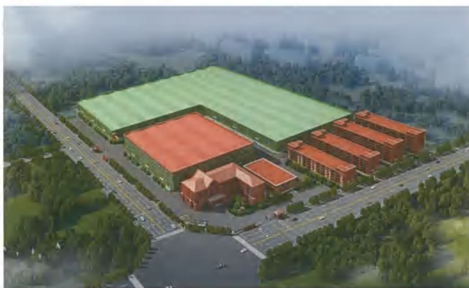
(图为年产 1000 万套智能厨具生产线项目鸟瞰图)

公司负责“年产 1000 万套智能厨具生产线项目”的实施与管理。该项目用地 135 亩，建筑总面积 18.5 万平方米，总投资约 10.2 亿元，2021 年 2 月 3 日开工建设，计划 2023 年建成，项目引进德国先进的智能机器人自动化生产线和立体无人仓储设备，建成后形成年产 1000-1500 万套智能厨具的生产能力，预计年产值可达 16-20 亿元，实现年税收 5960-10000 万。先进的蜂窝不粘技术及 0 涂层不粘技术，能实现更安全、更健康、更环保、防粘少油烟、易清洁、更美观适应市场需求的智能厨具。该项目也是浙江省“五个一批”重点工程项目之一。